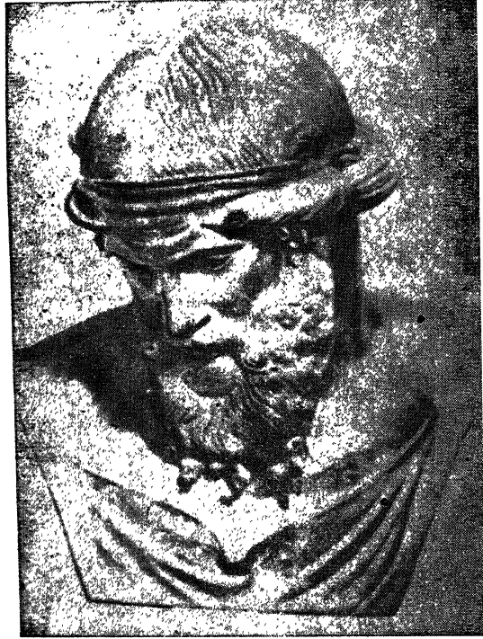
प्लेटो ( ४२८ ई० पू०-३४८ ई० पू० )